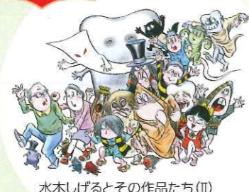
水木しげるとその作品たち(II) ©水木プロダクション

美術館内に音楽が流れます。ご家族でお話しながら鑑賞できます。(10:00～13:00)